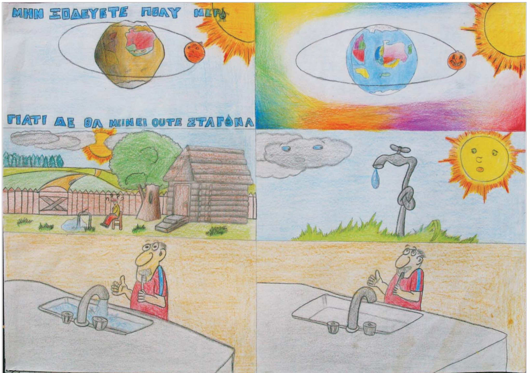
The Greek phrase on the painting is: "Don't waste too much water. Because there won't be a drop left."