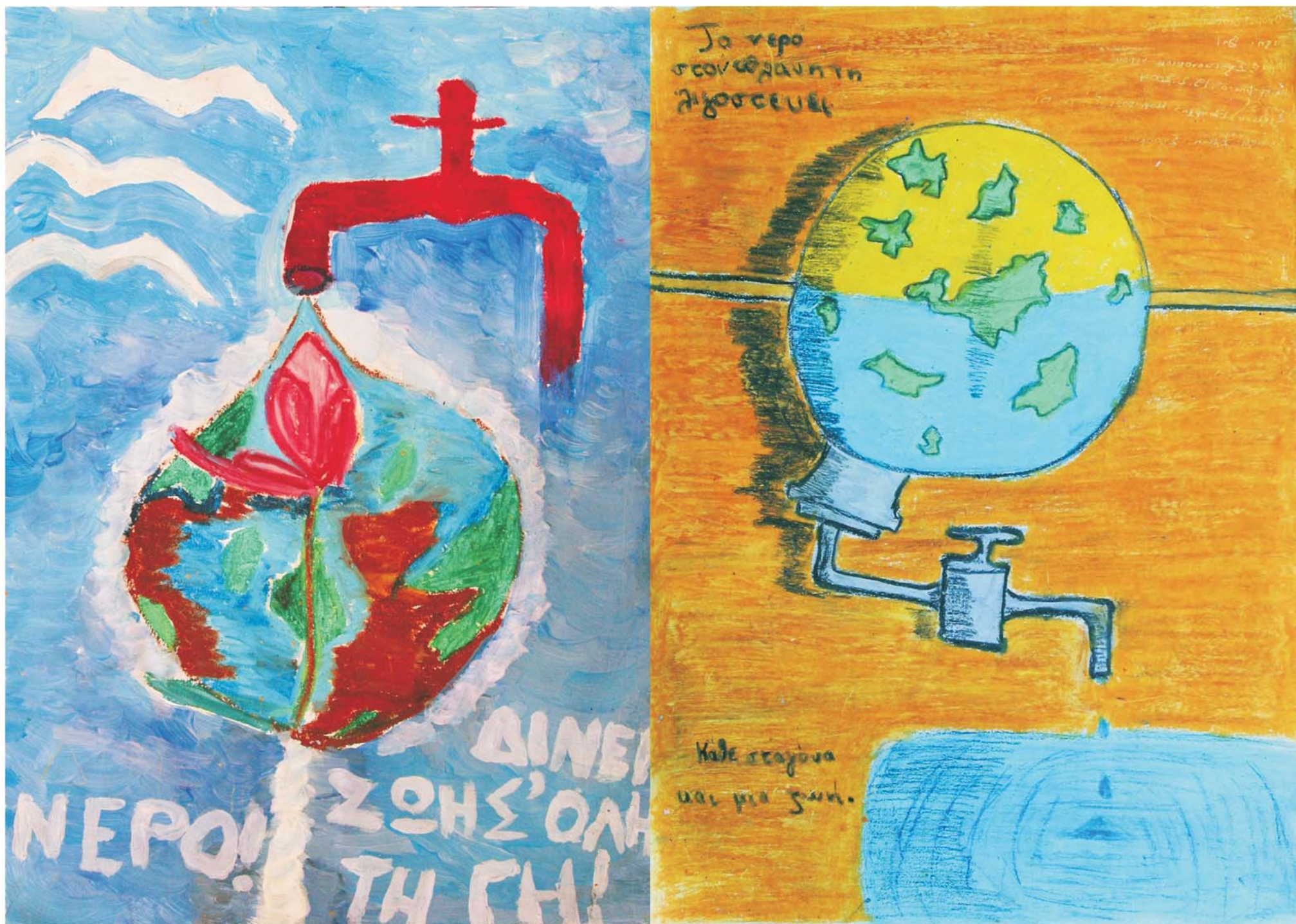
The Greek phrases on the painting are: "Water! Gives life to the whole world. Water on our planet become less and less. Each drop and a life."