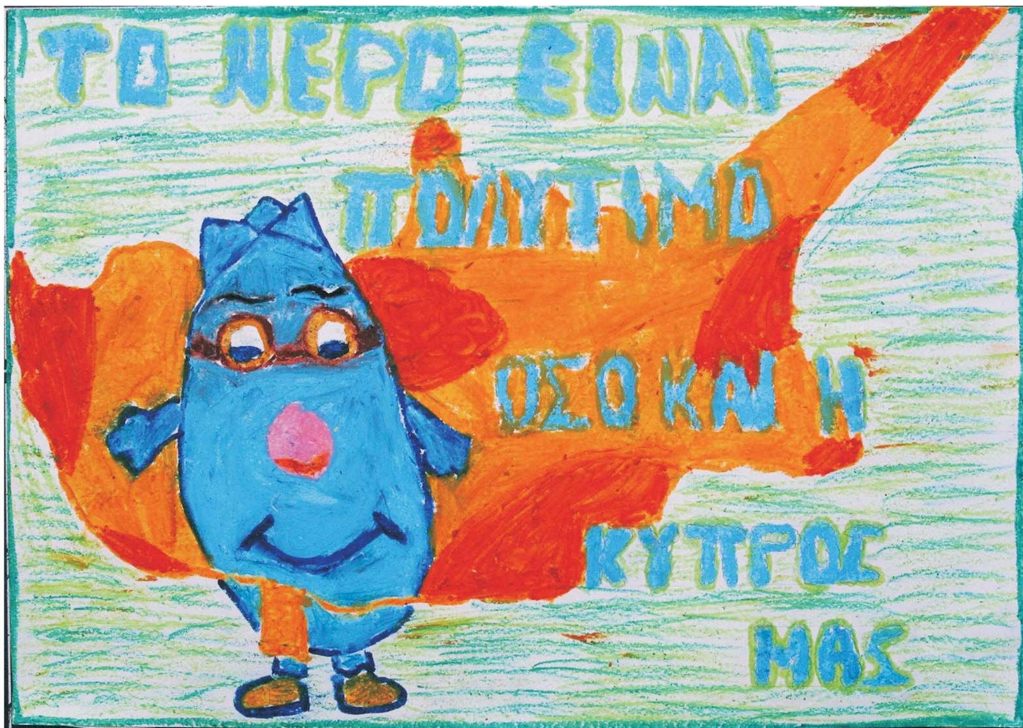
The Greek phrase on the painting is: "Water is as precious as Cyprus"